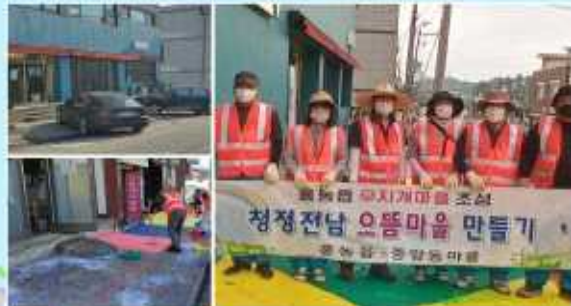
[시가지 진입로 경관 조성]