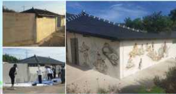
[마을 벽화 그리기]