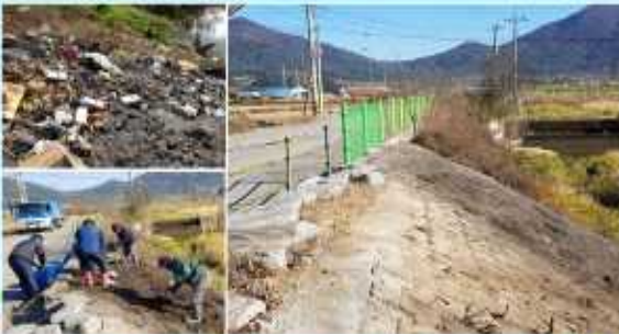
[마을 진입 도로변 꽃길 조성 및 마을 앞 아천 청결 유지]