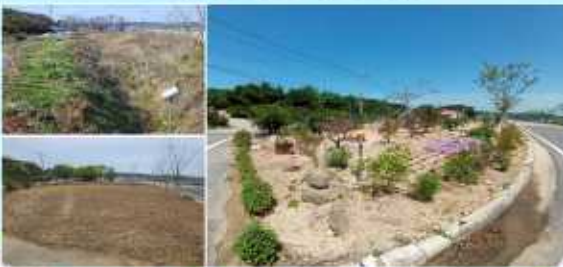
[마을 입구 꽃동산 조성]